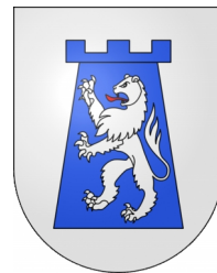
Comune di Losone